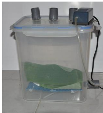
Gambar 2. Alat Fermentasi