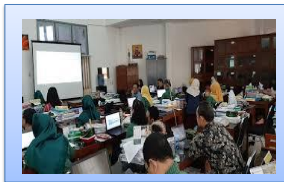
Gambar 3. Pembuatan Media Pembelajaran