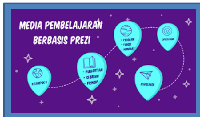
Gambar 4. Tampilan Hasil Prezi

Adapun salah satu tampilan yang telah dibuat oleh peserta :