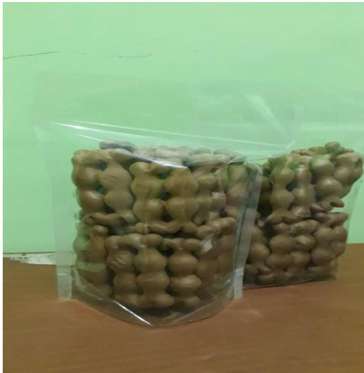
Gambar 2. Kemasan Produk Sebelum Pelatihan