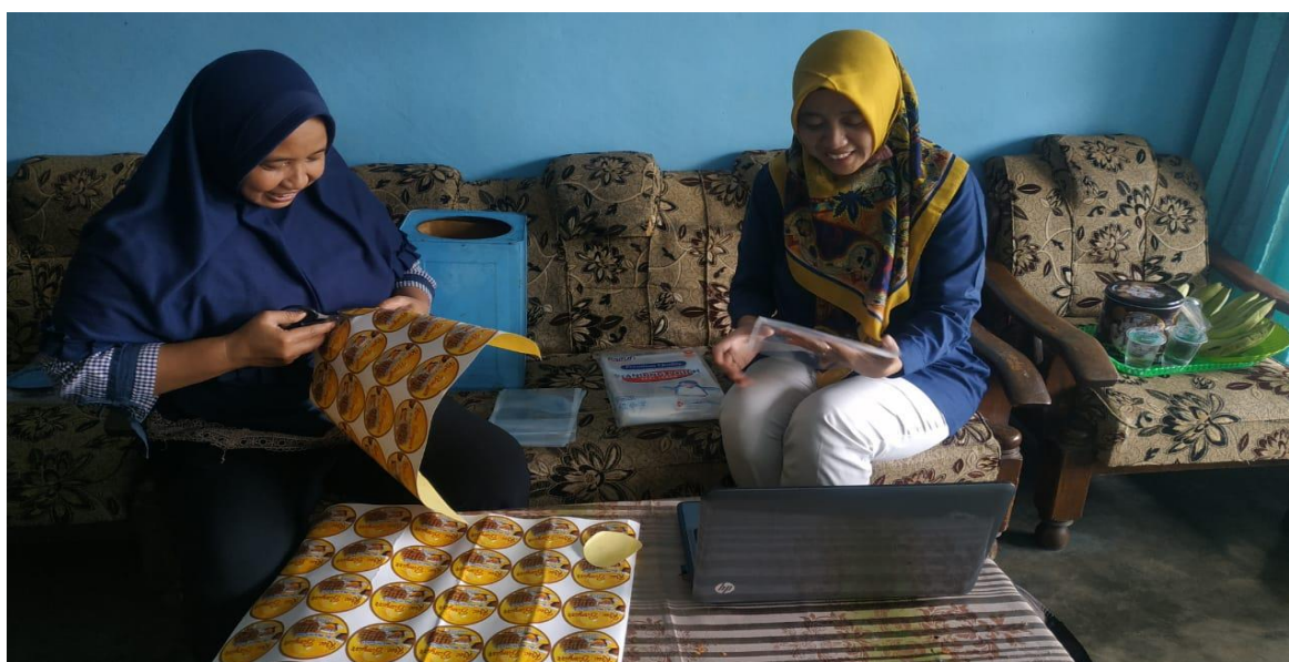
Gambar 1. Penyampaian Materi dan Praktek

Penyampaian materi Media sosial Sebagai Sarana Promosi Online dilakukan dengan metode ceramah, selanjutnya materi praktik adalah praktik membuat akun media sosial untuk bisnis dengan konten yang benar dan menarik.