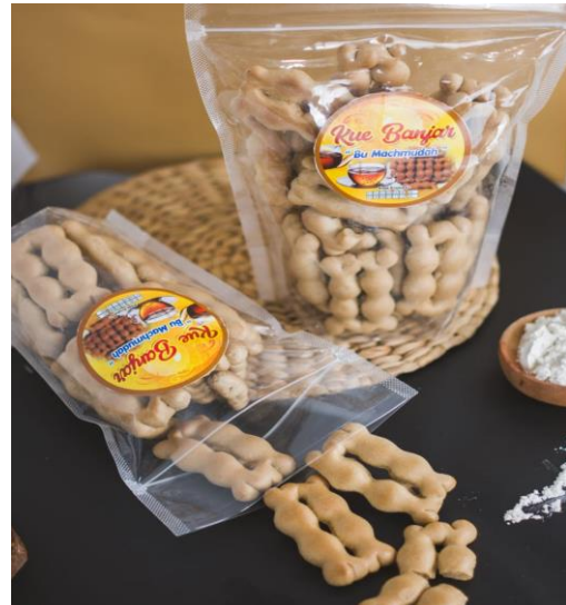
Gambar 3. Kemasan Produk Sesudah Pelatihan

Gambar 2, Kemasan produk kue banjar sebelum pelaksanaan pelatihan promosi online, kue banjar masih dikemas dengan cara yang sederhana, toples minimalis dan pouch tanpa stiker logo produk. Kemasan ini masih kurang maksimal apabila untuk promosi online. Pada Gambar 3, kemasan Kue Banjar sudah lebih menarik dilengkapi dengan logo dan dilakukan foto produk agar menarik untuk mengisi konten promosi di social media.